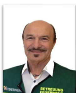
Feuerwehr Penz Willi FF Freistadt 0664/1300122